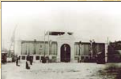
La construction des halles en 1900

Les Halles de Narbonne s'inscrivait donc dans un contexte économique et social tel, qu'elles ont été bâties à l'image de bon nombre d'autres marchés couverts en France de cette période de l'histoire. Mais chaque ville a apporté son identité propre. Et l'identité des Halles narbonnaise est d'autant plus forte qu'elles sont l'une des rares à avoir conservé leur emplacement et leur beauté d'origine. ■